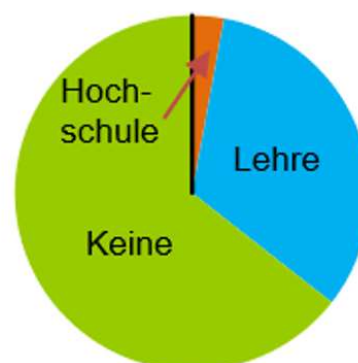
Ausbildung in der Schweiz