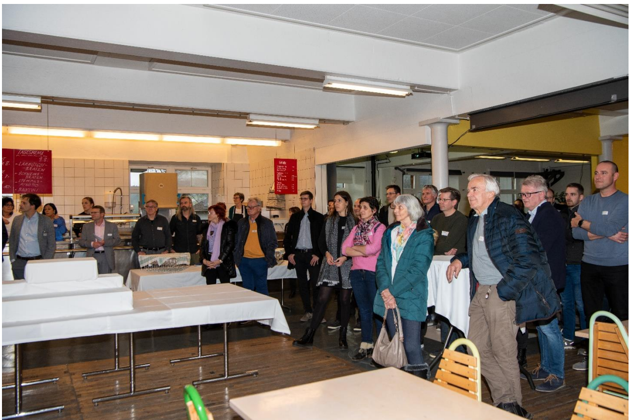
25 Jahre Kompass wird gefeiert mit Laudatio und Ansprachen