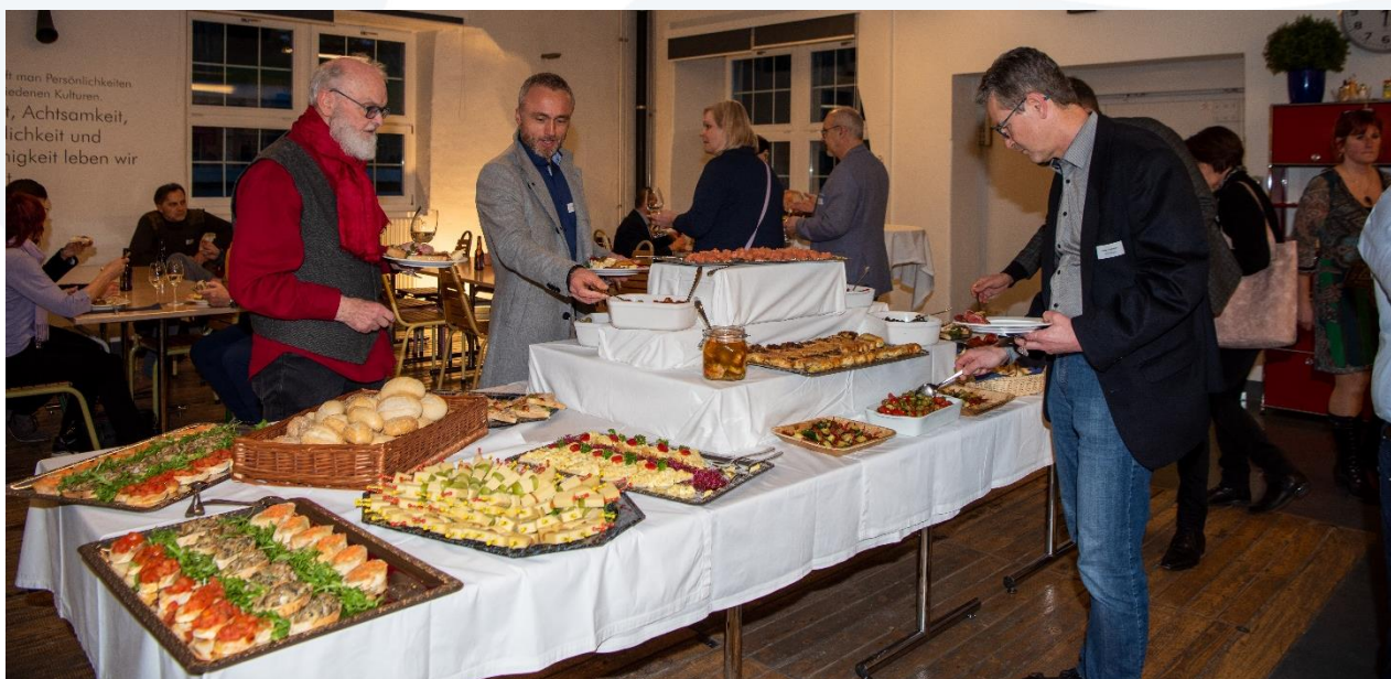
25 Jahre Kompass; Apéro riche lädt zum Verweilen und Vernetzen ein