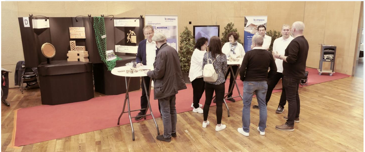
Im Gespräch mit RAV-Personalberatern

Wir konnten uns an diesem Forum erneut präsentieren und mit den Zuweisenden der RAV's ins persönliche Gespräch kommen. Auf der Bühne beim 2 Minuten Catwalk und an unserem Kompass-Stand präsentierten wir die ganze Kompassbreite und durften viele Komplimente mit nach Hause nehmen.