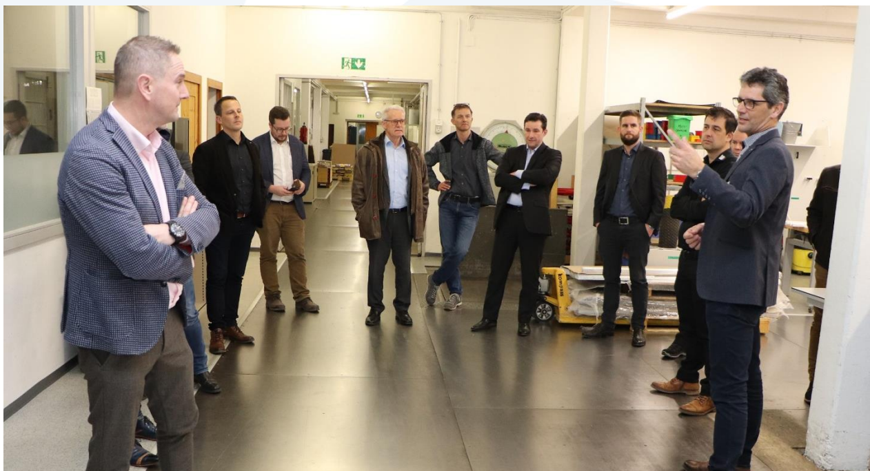
Kompass Besichtigung einer Gruppe von Arbeitgeber Mittelthurgau